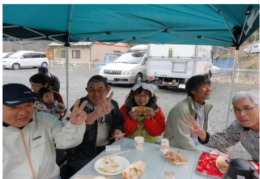
どれ食べてもおいしい! お皿はすぐに空になっちゃう

たこ焼きを焼く体験と、大 槌にいながら大阪の雰囲気 を味わえるイベントでし た。食べるだけでなく焼 くのも面白いですよ。生地 を流し込んで具材を入れ