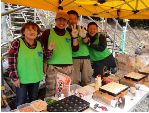
大阪の皆さん、とってもフレンドリーでした!!

【発行】大槌町地域支援員配置事業 〒028-1115 岩手県上閉伊郡大槌町上町 1-6 TEL : 0193-41-2780 E-Mail : otsch.info@gmail.com