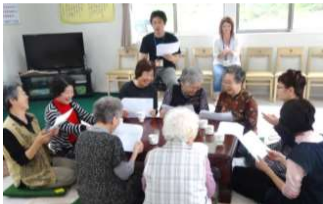
歌っている時とっても楽しそう！皆さん素敵な歌声です～♪