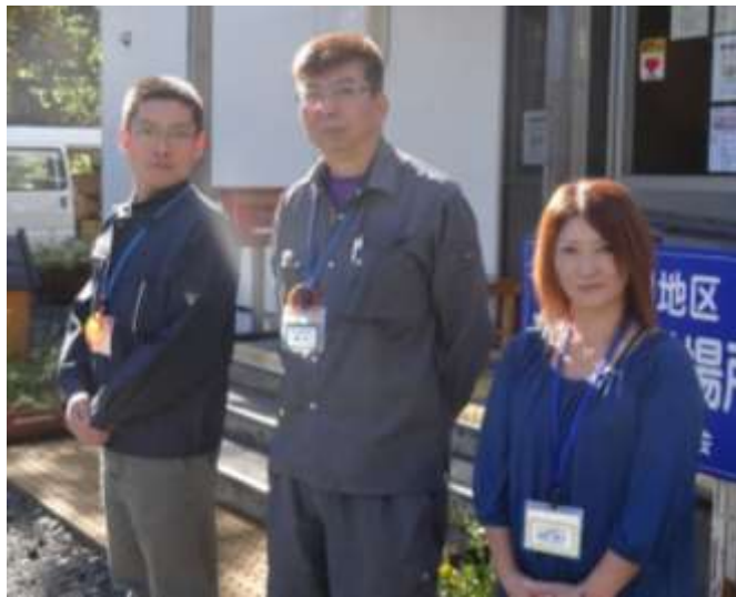
ここを担当している支援員です。これからもよろしくお願いします！

歌い終わった後は、お茶っこのタイム。「ここに来て発散している（笑）」と笑顔の住民さん。支援員は住民さんの笑顔や笑い声で「今日も元気で行っていきます。」