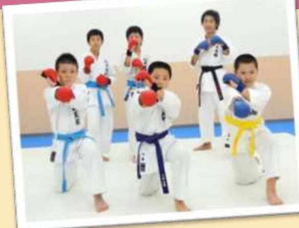
空手着姿が素敵です！稽古楽しいよ～！

今回は、シーサイドタウンマスの2階ホールにて空手道場を開いている「尚武会新風館」(しようぶかいしんぷうかん)におじゃましました。この日は、小学4年生から中学3年生の計6名が所属しています。毎週月曜日と金曜日に一生懸命に稽古しています。練習を見に行くと、空手着姿が素敵です！稽古楽しいよ～！