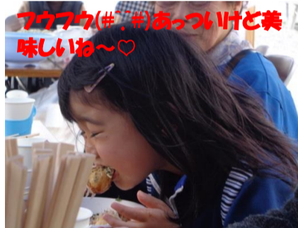
アウフウ(#.#)あつりけと美味しいね~♡

やっぱり焼きながら食べると 美味しいね~♪ どんだんたこ焼きに手が 伸びる住民さんなのでした(笑) 焼くのも楽しかったね~☆ 次はなにかな~(*_*)