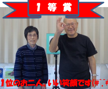
1位のお二人、いい笑顔です(#.#)