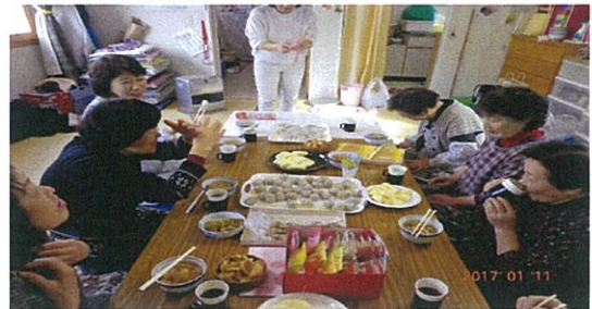
1月11日ふれあいサロン