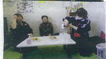
体を動かした後は水分補給を