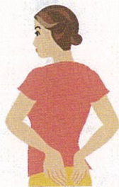
腕が後ろ側に動くかどうかを調べる方法。両手を腰にあてることができればいい。腕が後ろに回らなかつたり、回すときに痛みがあるときは、四十肩、五十肩が疑われる。