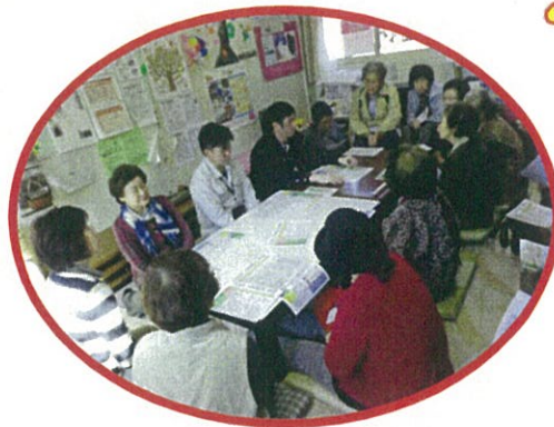
↑ゴミ出し勉強会の様子

また、紫波町でのぶどう狩りで顔見知りになっていた方も多く、「来年もまた会いましょう！」などの言葉を交して帰られました。